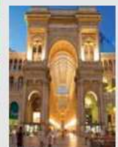
Galleria Vittorio Emanuele II