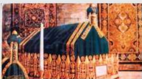
Maqam Rasulullah SAW