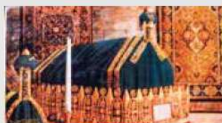
Maqam Rasulullah SAW

Aturcara am ini adalah sebagai rujukan awal sahaja dan tertakluk kepada perubahan jadual penerbangan, perubahan masa dan lain-lain faktor semasa di luar kawalan syarikat